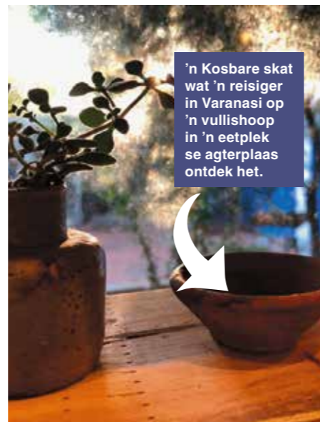
'n Kosbare skat wat 'n reisiger in Varanasi op 'n vullishoop in 'n eetplek se agterplaas ontdek het.

Sy ken nie die pottebakker nie. Hy kan een van 1 363 416 218 mense in Indië wees. Hy weet nie sy handewerk staan nou op 'n kombuisvensterbank in 'n huis in Johannesburg nie. 'n Kosbare skat wat 'n reisiger in Varanasi op 'n vullishoop in 'n eetplek se agterplaas ontdek het. Dié waardelose, gebruikte bakkie is een van miljoene groottes en vorms wat jaarliks deur pottebakkers gemaak word om uit te eet, te drink en dan weggegooi word om weer in die aarde vir nuwe lewe te ontbind.