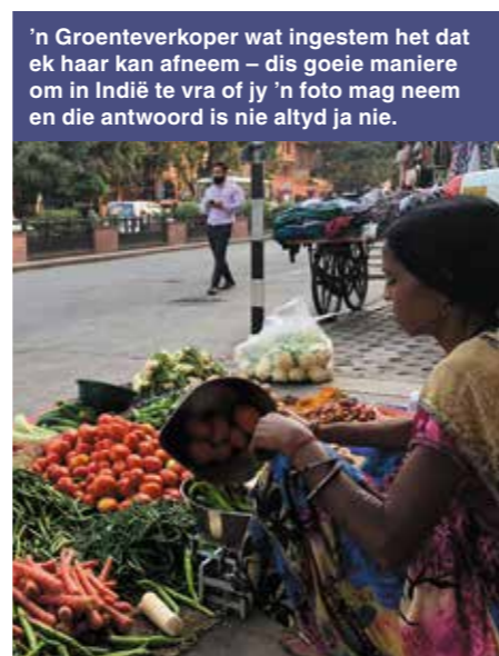
'n Groenteverkoper wat ingestem het dat ek haar kan afneem – dis goeie maniere om in Indië te vra of jy 'n foto mag neem en die antwoord is nie altyd ja nie.