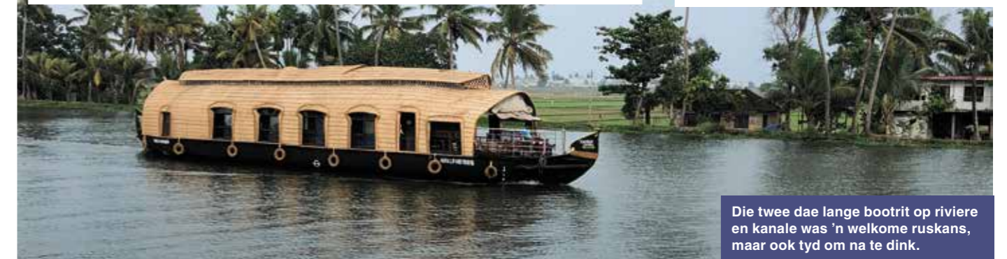
Die twee dae lange bootrit op riviere en kanale was 'n welkome ruskans, maar ook tyd om na te dink.

Twee dinge wat in Moembaai vir my uitstaan, is die dabbawalas en die openbare wassery wat ek sommer die wishiwashi noem. Die dabbawalas is 'n tradisionele "lunchbox"-diens wat met treine en fietse gelewer word en die wishiwashi is 'n gebied in Moembaai waar mense se wasgoed gewas word nadat dit by jou huis afgehaal en weer daar afgelewer word. Volgens Moembaaiers sluip daar nooit foute in nie. V!