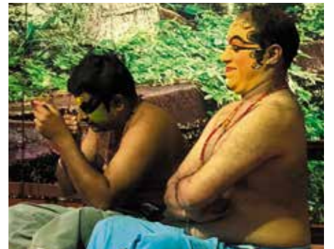
Kathakali-akteurs sit grimering aan voor die vertoning.

In MOEMBAAI is daar ongelooflike rykdom en vreeslike armoede – soos in Suid-Afrika – maar volgens mense wat Moembaai gereeld besoek, is dié stad 'n bewys van die afgelope tien jaar se vooruitgang in Indië. Tekens van verbetering en vooruitgang gee my altyd moed.