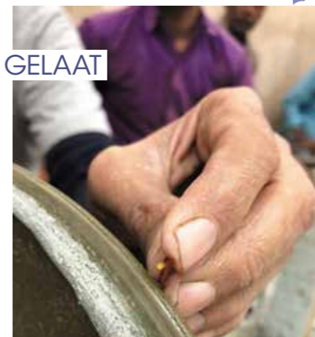
'n Vakman besig om 'n piepklein stukkie halfedelsteen tot perfeksie te slyp vir inlegwerk – 'n kuns wat van een generasie na 'n volgende oorgedra word.

Jaipur is bekend vir vakmanskap oor generasies heen in die sny en slyp van halfedelstene (veral granaatstene en robyne) asook koperinlegwerk, lakwerk, drukwerk op lap (moeseliën) en die weef van die wonderlikste tapyte. Die kuns van inlegwerk met halfedelstene word van geslag na geslag oorgedra en wat jy op die antieke mure sien, word vandag nog net so gedoen.