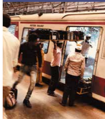
Dabbawalas laai die dag se tuisgemaakte kospakkies af, waar dit verder met fietse vervoer word.