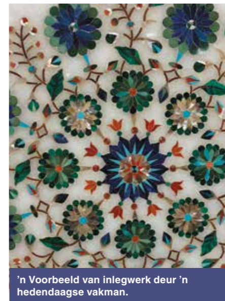
'n Voorbeeld van inlegwerk deur 'n hedendaagse vakman.