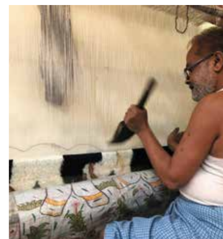
Nou verstaan ek hoekom handgemaakte tapyte so duur is – dit verg briljante vakmanskap en ure se werk.