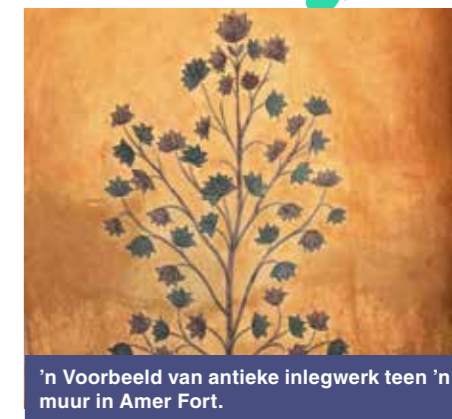
'n Voorbeeld van antieke inlegwerk teen 'n muur in Amer Fort.

Het jy al gehoor van iemand wat seesiek raak op 'n olifant se rug? Wel nou het jy. Dié rit op na Amer Fort was net kort genoeg om nie groen om die kiewe af te klim nie. Ek moet bieë, ek was nogal ambivalent oor hierdie avontuur, want 'n mens lees dikwels van olifante in ander wêrelddele wat onder slegte omstandighede vir toeristepret aangehou word.