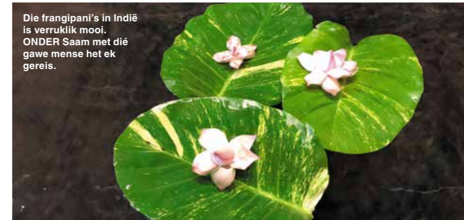
Die frangipani's in Indië is verruklik mooi. ONDER Saam met dié gawe mense het ek gereis.

G'n mens kan in 'n paar bladsye 'n reis van twee weke deur Indië in besonderhede beskryf nie. Indië maak stories in 'n mens wakker ... ►