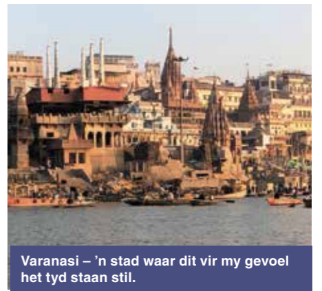
Varanasi – 'n stad waar dit vir my gevoel het tyd staan stil.

Aan die suidelike kus van Indië lê Kumarakom, wat bekend is vir huisbote wat op die rivier en kanale vaar. Weerskante groei klapperbome, sien jy mense werk in ryslende en staan huisies waar mense in hul bekende wêreld leef – onbewus van my lewe kilometers ver. Ons tweedaevaart is kalm en rustig – 'n welkome lafenis ná 'n sensoriese oordosis om asem te skep en te begin verwerk wat ek ervaar.