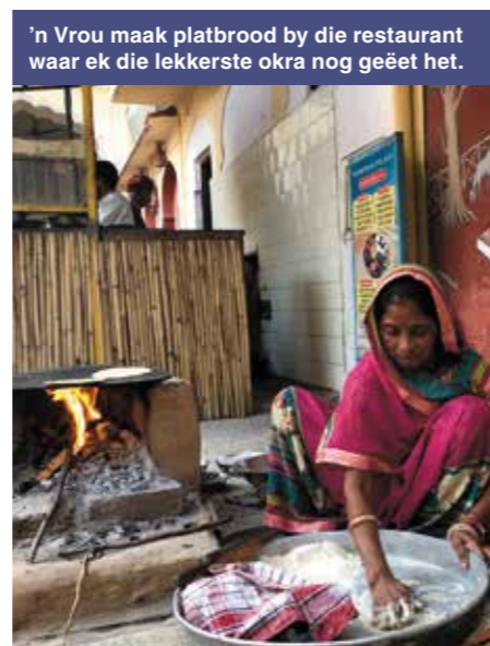
'n Vrou maak platbrood by die restaurant waar ek die lekkerste okra nog geëet het.